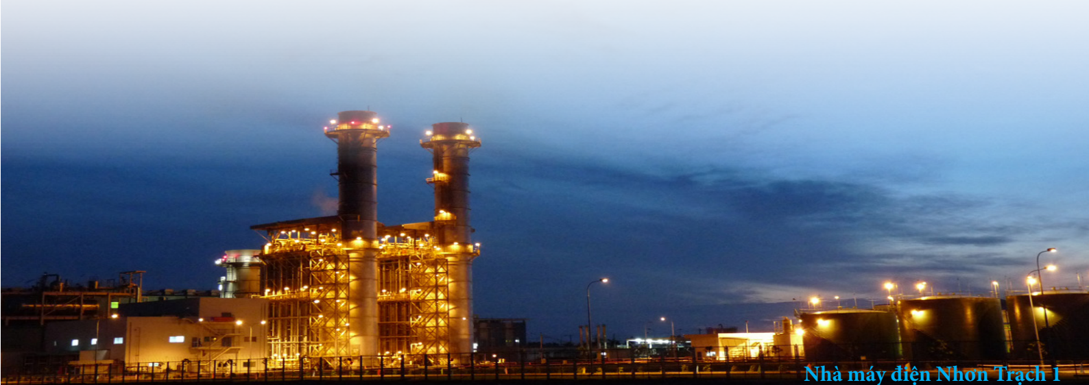
Nhà máy điện Nhơn Trạch 1

Dự án NMĐ Nhơn Trạch 3&4: PV Power đang xem xét và thẩm tra Hồ sơ Thiết kế cơ sở FS của dự án do đơn vị tư vấn PECC2 lập. PV Power đang tiếp tục làm việc với các tổ chức tín dụng, ngân hàng trong công tác thu xếp vốn cho dự án; đồng thời tổ chức làm việc với EVN EPTC và PV Gas để đàm phán các nội dung trong Hợp đồng mua bán điện và Hợp đồng mua bán khí cho dự án.