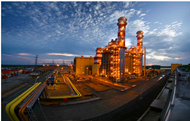
Nhà máy điện Cà Mau 1

- Nhà máy thủy điện Đakrinh: Lưu lượng nước trung bình về hồ nửa đầu tháng 7 tương đương trung bình tháng 7 nhiều năm. Do vậy nhà máy cân đối chào giá và phát điện tranh thủ thời điểm giá cao để đảm bảo hiệu quả tối ưu, nhà máy đạt sản lượng kế hoạch được giao.